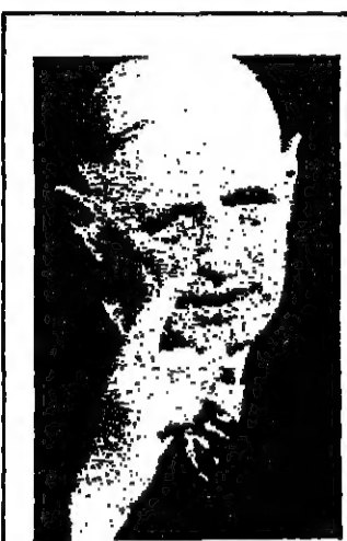
وكان « نجبول » لا يرى من اية مشكلة الا تأثيرها على عظمة فرنسا ودورها الخاص في العارة الأوروبية

هكذا بقي صراع بحر ايجي محصوراً في اطار الاسرة